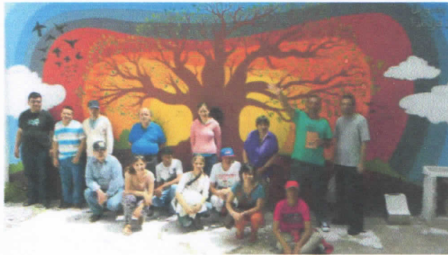
Mayo de 2016 Venta Económica en la feria de la Plaza Asamblea