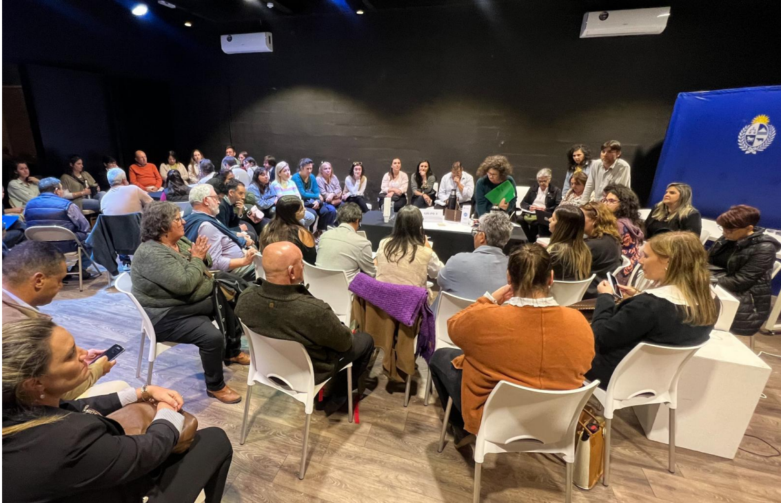
Grupo de trabajo