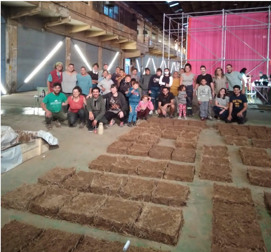
equipo técnico FADU, vecinos y cuadrilla ABC_IM