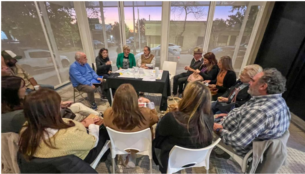
Grupo de trabajo