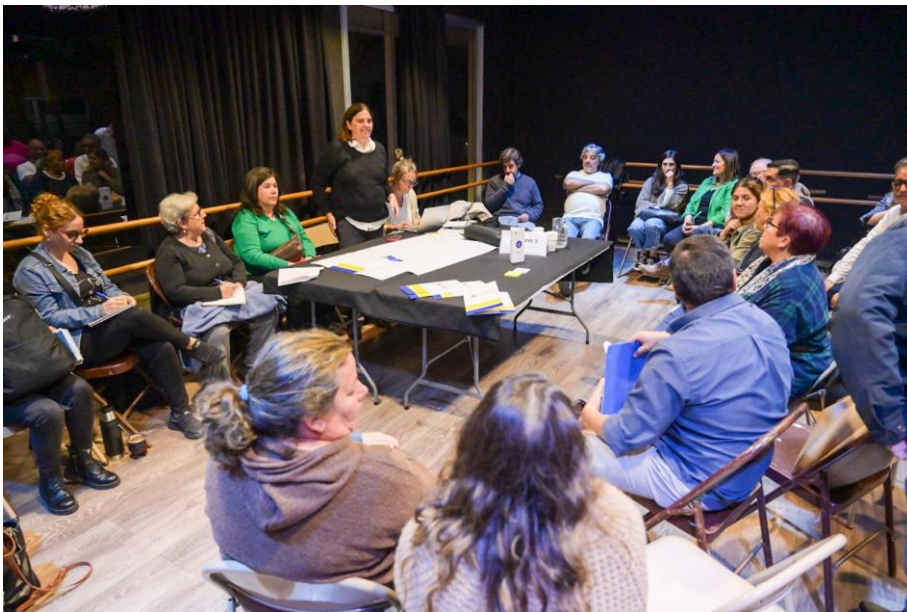
Grupo de trabajo